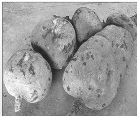
กวาวเครือ ( Pueraria candollei var. mirifica )