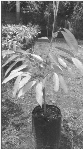
ทุเรียน ( Durio zibethinus )

ที่นำไปรับประทาน กวาวเครือที่ผ่านกระบวนการและไม่สามารถใช้เป็นส่วนขยายพันธุ์ได้ ทองเครือที่ผ่านกระบวนการและไม่สามารถใช้เป็นส่วนขยายพันธุ์ได้ ผลลับประรดและหัวจุกที่ติดไปกับลับประรด