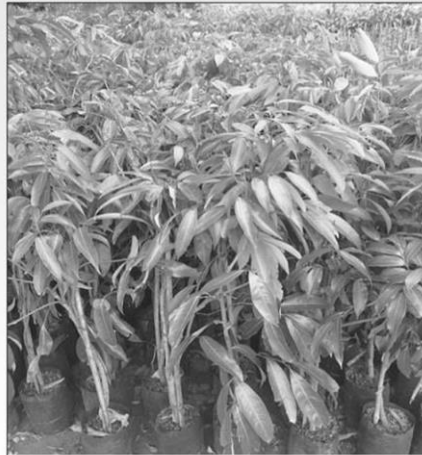
ลิ้นจี่ ( Litchi chinensis )

อย่างไรก็ตาม หากต้องการส่งออกต้นพืชสกุล Cocos spp. ต้องสามารถยืนยันจากหลักฐานซึ่งพิสูจน์ได้ และมีความน่าเชื่อถือได้ว่าต้นพืชดังกล่าวไม่ใช่ต้นมะพร้าวน้ำหอม ( Cocos nucifera ) ซึ่งจัดเป็นพืชสงวนของไทย