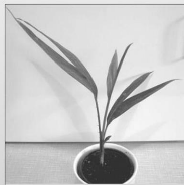
สละ ( Salacca zalacca )

การห้ามส่งออกพันธุ์พืชที่กล่าวมาข้างต้นหมายรวมถึงทุกสายพันธุ์ของพืชชนิดนั้นๆ แต่ของมะพร้าว จะเป็นมะพร้าวแก่พันธุ์เล็กที่มีน้ำหนักผลแก่ต่ำกว่า 1,000 กรัม และผลเส้นรอบวงต่ำกว่า 50 เซนติเมตร แต่ก็จะมีข้อยกเว้นคือ ผลทูเรียน ส้มโอ องุ่น ลำไย ลิ้นจี่ สละและเมล็ดที่ติดไปกับผล ฝักและเมล็ดที่ไปติดกับฝักมะขาม มะพร้าวผลสด