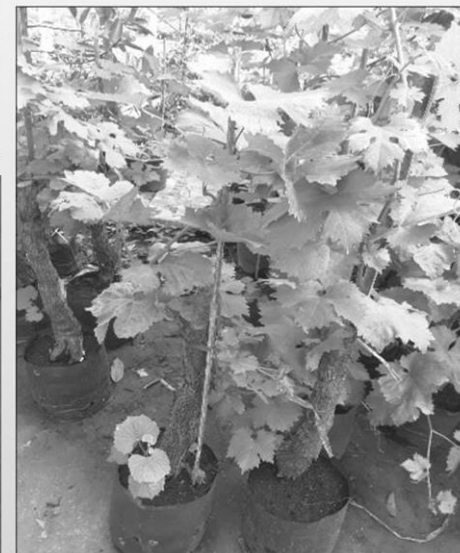
องุ่น ( Vitis vinifera )