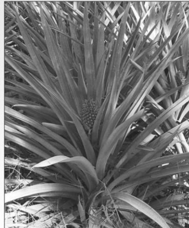
สับปะรด ( Ananas comosus )