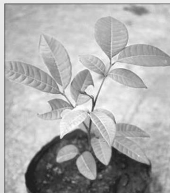
ลำไย ( Dimocarpus longan )