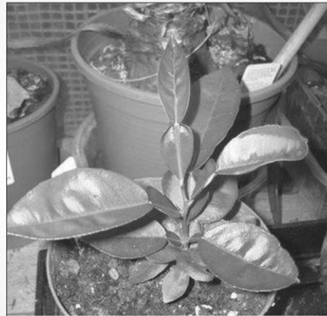
ส้มโอ ( Citrus maxima )