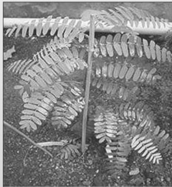
มะขาม ( Tamarindus indica )