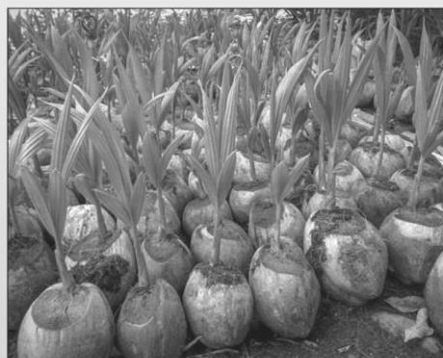
มะพร้าว ( Cocos nucifera )